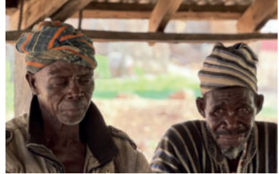
Zo ook de vaders

Ze weten dat ze op eigen kracht verder moeten en hebben daar zelf veel vertrouwen in. Hierbij nog een opsomming van wat mede dankzij u door de jaren heen allemaal tot stand is gekomen. De bouw van een ziekenhuis, huizen voor verplegend personeel, school in Yikpabongo en onderwijzerswoningen in Yikpabongo, Tuvuu en Zukpeni, aanleg van de 6,2 kilometer weg van Tuvuu naar Yikpabongo. Maar ook onderwijzers financieel ondersteund, leveren van schoolboeken, uniformen en schrijfbenodigdheden, medicijnen met name serum tegen slangenbeten. Ook ziekenhuis en schoolmeubilair, fietsen, kleding en speelgoed voor kinderen. En laten we niet vergeten de 32 kinderen die een goede scholing hebben ontvangen en betere toekomstmogelijkheden hebben.