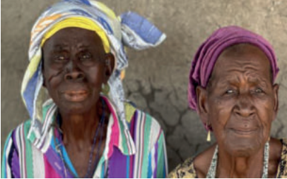
Deze moeders zijn u en ons zeer dankbaar

We wisten dat deze reis lastig en emotioneel zou zijn om de boodschap te brengen dat Stichting Ghana Medical Support in 1985 opgericht, na 38 jaar gaat stoppen. Mede dankzij onze jarenlange ondersteuning heeft de ontwikkeling van de regio aldaar een goede impuls gekregen. Zo zijn de bewoners ons dan ook zeer dankbaar voor alles wat wij voor hen hebben betekend. Namens alle dorpen mogen wij u dan ook bedanken voor uw ondersteuning en support.