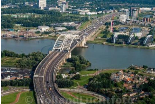
De Van Brienenoordbrug