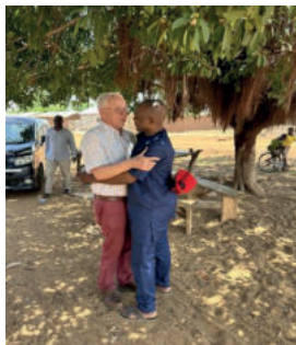
Afscheid nemen is niet makkelijk