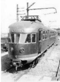
Mat '46 treinstel bij Tilburg, september 1954

Tussen 1948 en 1952 werden 65 vierwagengestellen (serie 641-705) en 79 tweewagengestellen (serie 221-299) in dienst gesteld. De tweewagengestellen werden genummerd vanaf 241 en pas later vanaf 221 omdat de tussengelegde nummers aanvankelijk nog in gebruik waren voor de tweewagengestellen uit de Mat '36-serie.