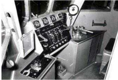
Mat 46 Cabine

vervoersgroei een tekort aan materieel en men besloot een aantal stellen nog een levensduur verlengende opknapbeurt te geven en langer in dienst te houden. De machinisten hadden hier tegen ernstige bezwaren en wilden niet langer op dit materieel rijden, vooral vanwege de kwetsbaarheid van de machinist bij een aanrijding in de lage en krappe cabine. Een deel van dit bezwaar werd weggenomen door het materieel '46 zo veel mogelijk samen met ander materieel in te zetten, waarbij het materieel '46 achteroliep en de cabine niet werd gebruikt.