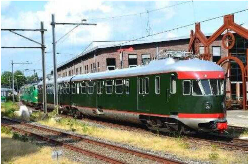
Treinstel NS 273 in het Spoorwegmuseum

de jaren negentig gerestaureerd en teruggebracht in de oorspronkelijke kleuren en wordt tegenwoordig voor bijzondere ritten gebruikt.