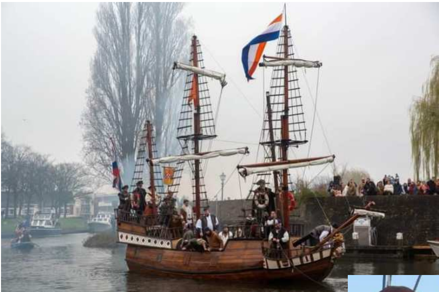
Dit is een replica van een Spaans Galjoen schaal 1:3

Ikzelf ben bemanningslid op de Prince Admiraal of te wel kokkie wat mijn functie aan boord is.