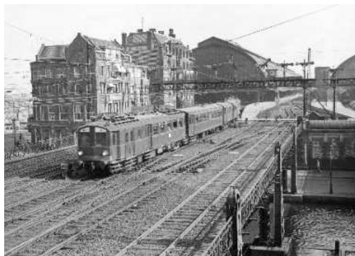
Trein bestaande uit buffermaterieel ('blokkendozen', mat '24) bij het Amsterdamse Centraal Station; 1953.

De NS had in de Tweede Wereldoorlog nog geen elektrische locomotieven in dienst, hoewel contacten met leveranciers al liepen en na de oorlog resulteerden in de 1000-serie. Al in de zomer van 1940 ontstonden tekorten aan stoomlocomotieven voor het trekken van goederentreinen. Doordat dieseltreinen buiten dienst werden gesteld wegens motorbrandstoftekort, materiaalgebrek in de werkplaatsen, verplicht onderhoud aan stoomlocomotieven van de Deutsche Reichsbahn en toegenomen vervoer waren meer trekkrachten nodig. Voor het trekken van zware goederentreinen op het Middennet en de Oude Lijn werden van het Blokkendoosmaterieel vijf formaties van drie motorrijtuigen gemaakt. Hiermee werden vooral de zware kolentreinen afkomstig van de Limburgse mijnen tussen Eindhoven en het westen van Nederland getrokken. In 1942 nam door een strenge winter en een daardoor hoge defectenstand het tekort aan locomotieven dusdanig toe, dat het aantal combinaties met acht werd uitgebreid.