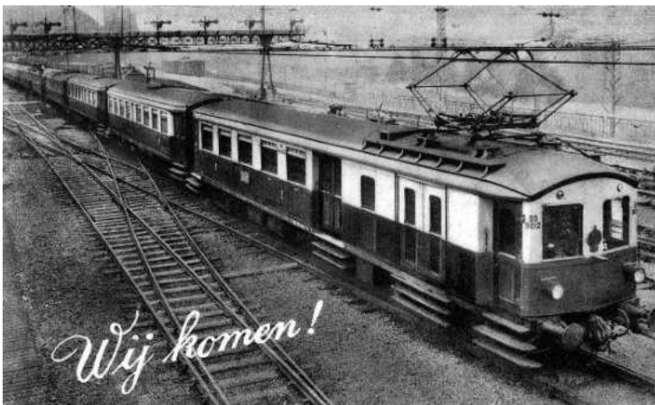
Elektrische trein van de NS van het type Materieel '24 te Amsterdam CS; circa 1927. Vooraan motorwagen BD 9012.