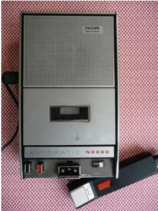
Mijn cassettespeler van weleer in volle glorie

Tijdens het schrijven van dit epistel kreeg ik een 'flashback' uit de jaren '70. Voor 99 gulden had ik een cassetterecorder van Philips gekocht. Voor mij een ongekende uitvinding. Mooier kon het leven niet worden. Wat een geweldig apparaat. Ik kocht de cassetterecorder van de centen die ik destijds verdiende als turnleraar bij een Amsterdamse turnclub waarvan ik de naam niet meer weet. Bij die cassette zat een microfoon. Tijdens de colleges zette ik de